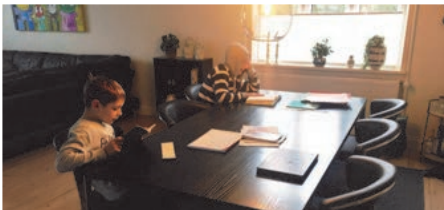
TV: Stuen er indrettet til hjemmeskole.