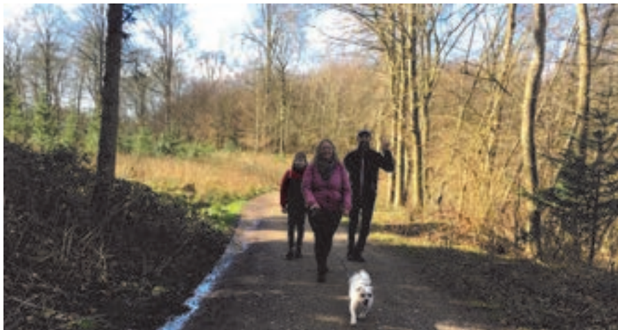
Der bliver gået nogle ekstra lange gåture.