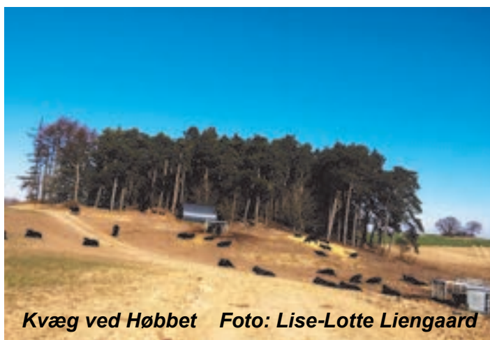
Kvæg ved Høbbet